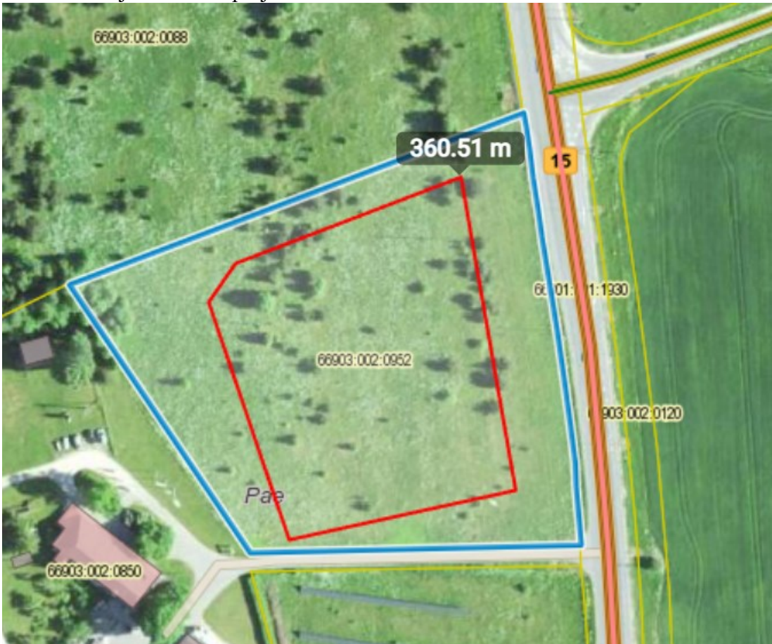
Joonis 2. Väljavõtte Maa-ameti kaardirakendusest.